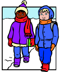
VESTIRSE EN CAPAS